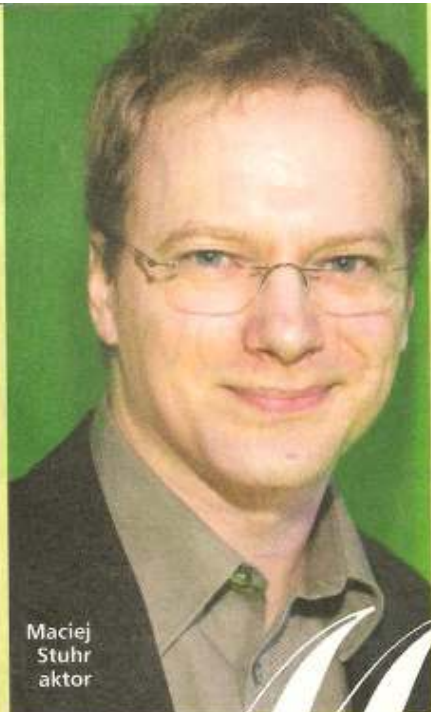
Maciej Stuhr aktor